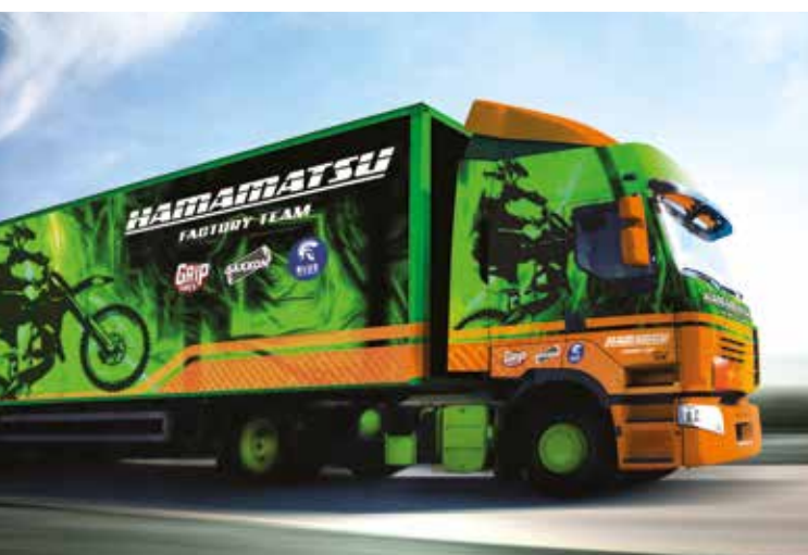
RÓTULOS PARA VEHÍCULOS