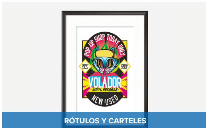
RÓTULOS Y CARTELES