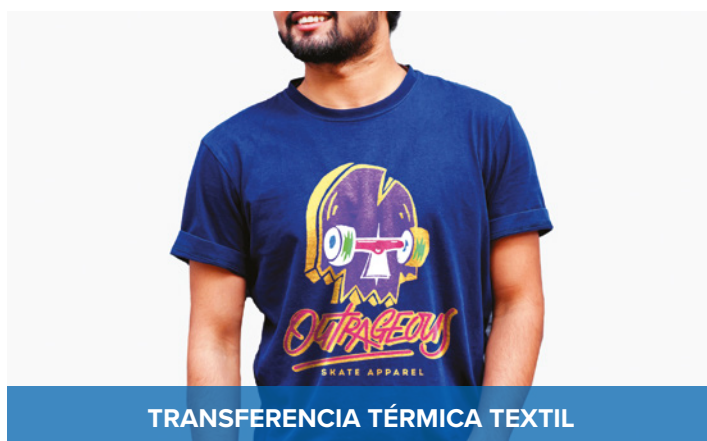
TRANSFERENCIA TÉRMICA TEXTIL